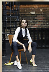
NEOBLU GABIN WOMEN 03163