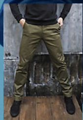
NEOBLU GUSTAVE MEN 03178