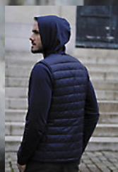
NEOBLU ARTHUR MEN 03172